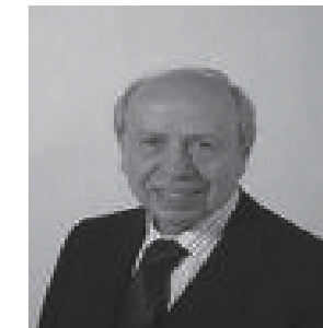
L'autore della prima riforma che ha affossato la pensione pubblica: Lamberto Dini!!!

raggiunta «quota 95», con 59 anni di età, dal 1° gennaio 2011 l'età pensionabile raggiungerà i 60 anni, con